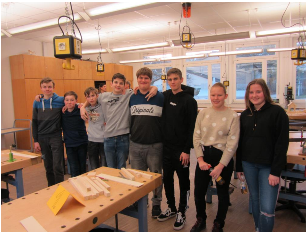
Im Fach Technik konnte man (von erfahrenen Schülern betreut) praktisch arbeiten