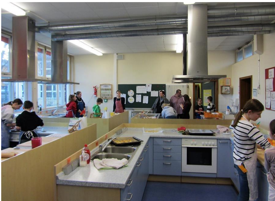
Beim Backen im Fach AES (Alltagskultur, Ernährung, Soziales)