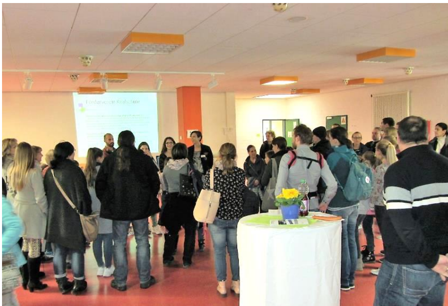
Bei der Begrüßung der Besucher im Foyer

Die Elternvertreter und der Förderverein übernahmen die ausgezeichnete Bewirtung der Veranstaltung.