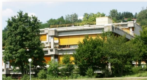
Das Gebäude der Realschule seit 1976