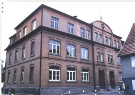
Das Gebäude der Realschule 1965 – 1976 (heute: Gebäude der Brunnenschule)